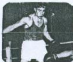
Борис Георгиев бокс (75 kg) бронзов медал Хелзинки 1952 г.